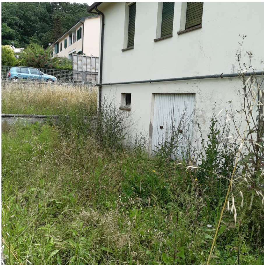
Foto 13: Prospetto Ovest particolare ingresso locali di sgombero (foto giugno 2020)