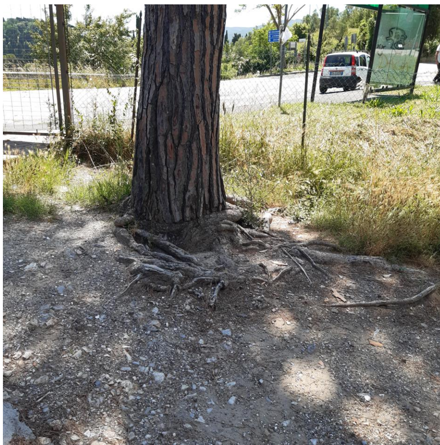
Foto 24: resede lato Sud particolare radici affioranti (foto giugno 2020)