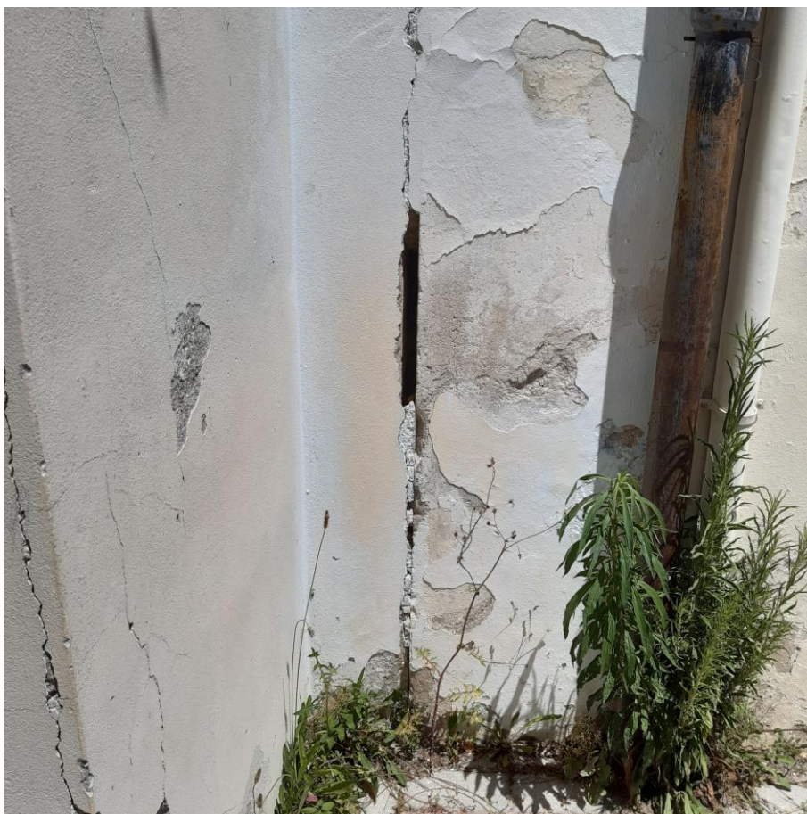
Foto 21: Prospetto Ovest particolare giunto sismico in degrado (foto giugno 2020)