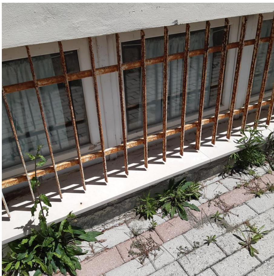
Foto 22: Prospetto Ovest Particolare infisso e inferriata ossidata (foto giugno 2020)