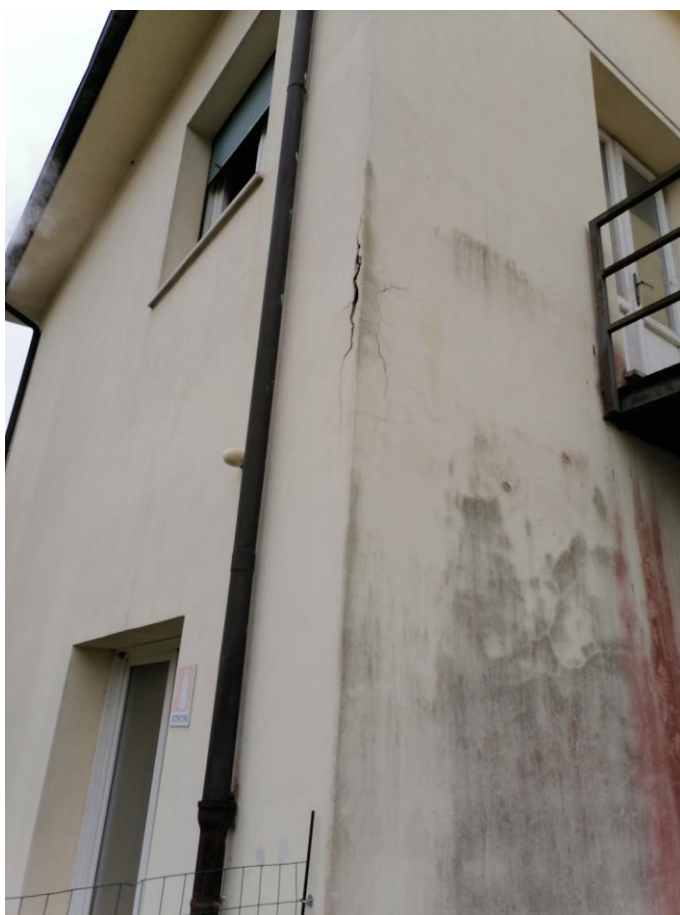
Foto 14: Prospetto Ovest particolare intonaco in degrado e armature ossidate