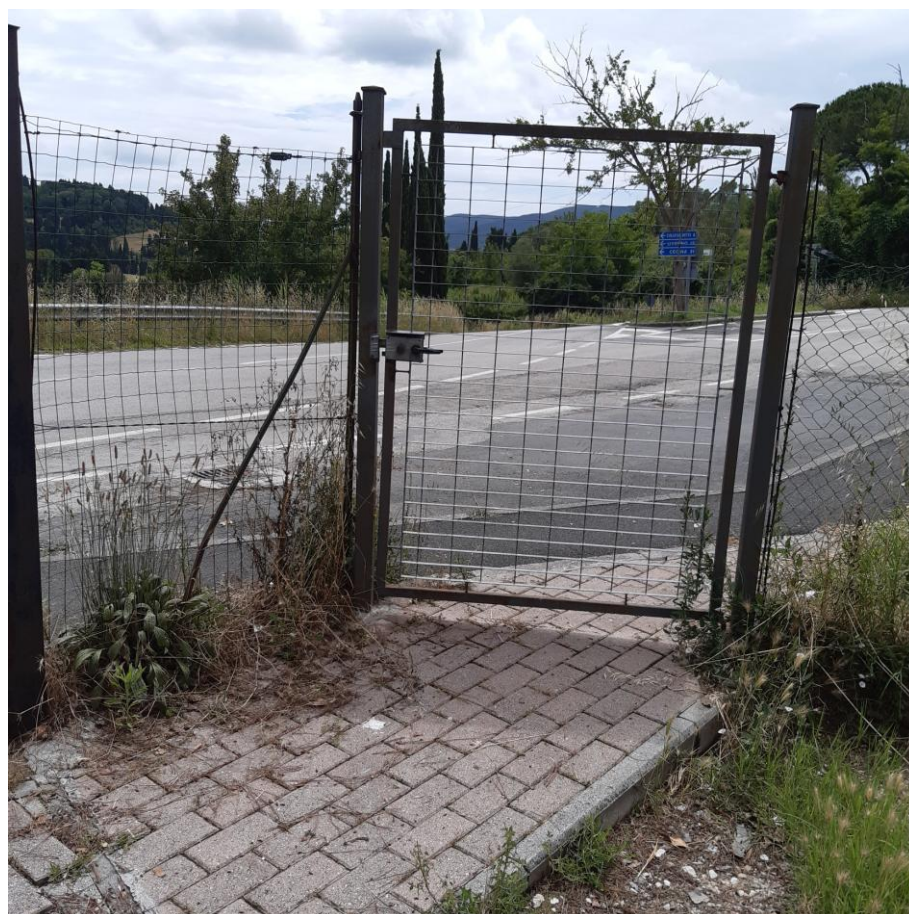
Foto 26: particolare cancello Pedonale ingresso secondario (foto giugno 2020)