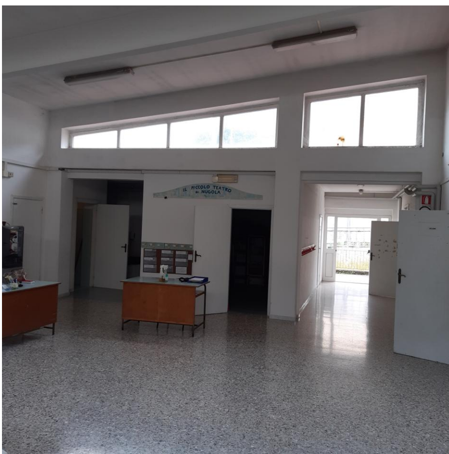
Foto 34: sala attività collettive, vista infissi in legno (foto giugno 2020)