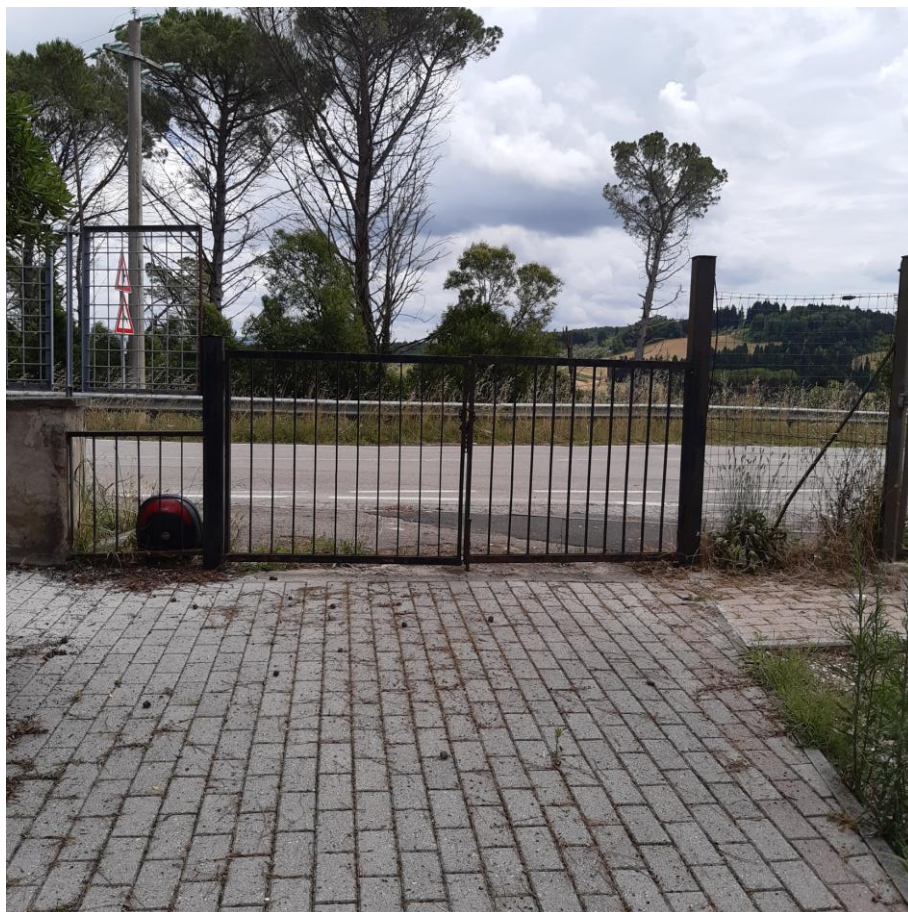
Foto 25: particolare cancello ingresso secondario (foto giugno 2020)