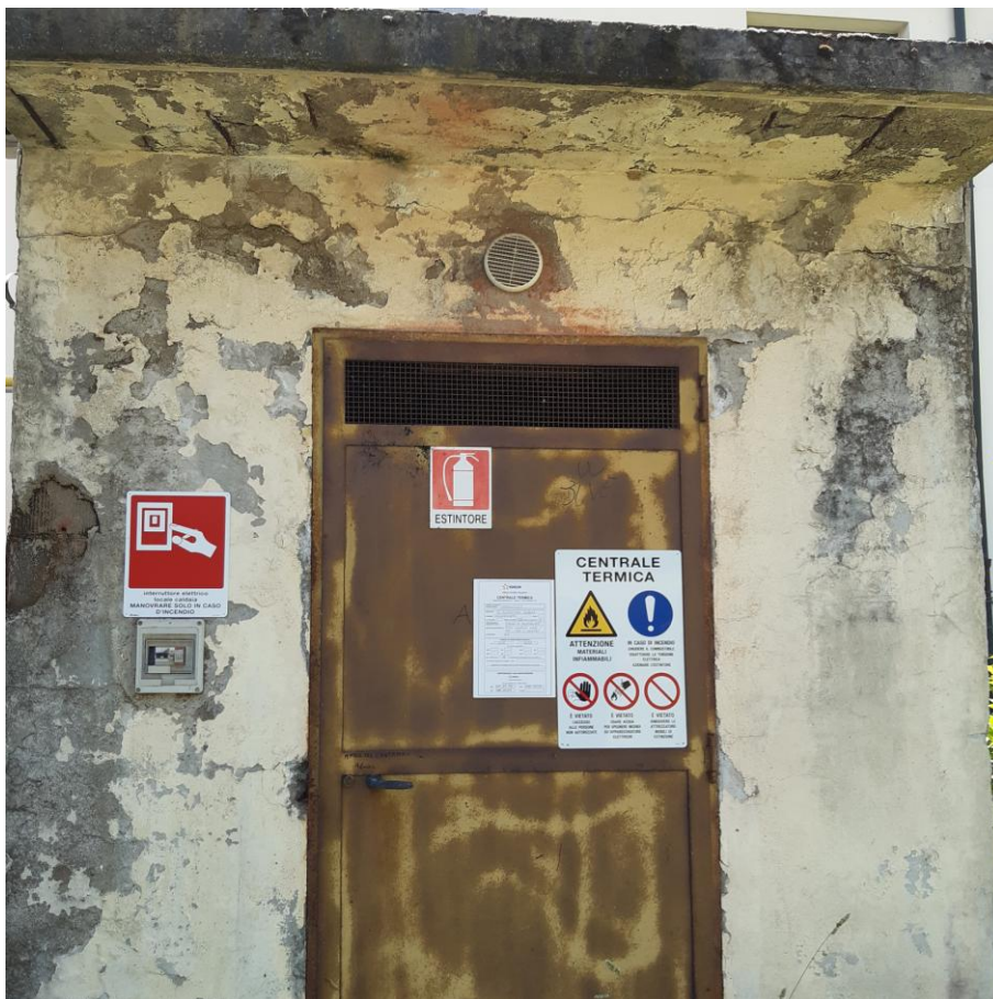
Foto 16: Locale caldaia, intonaci in degrado, gronda con ferri ossidati a vista (foto giugno 2020)