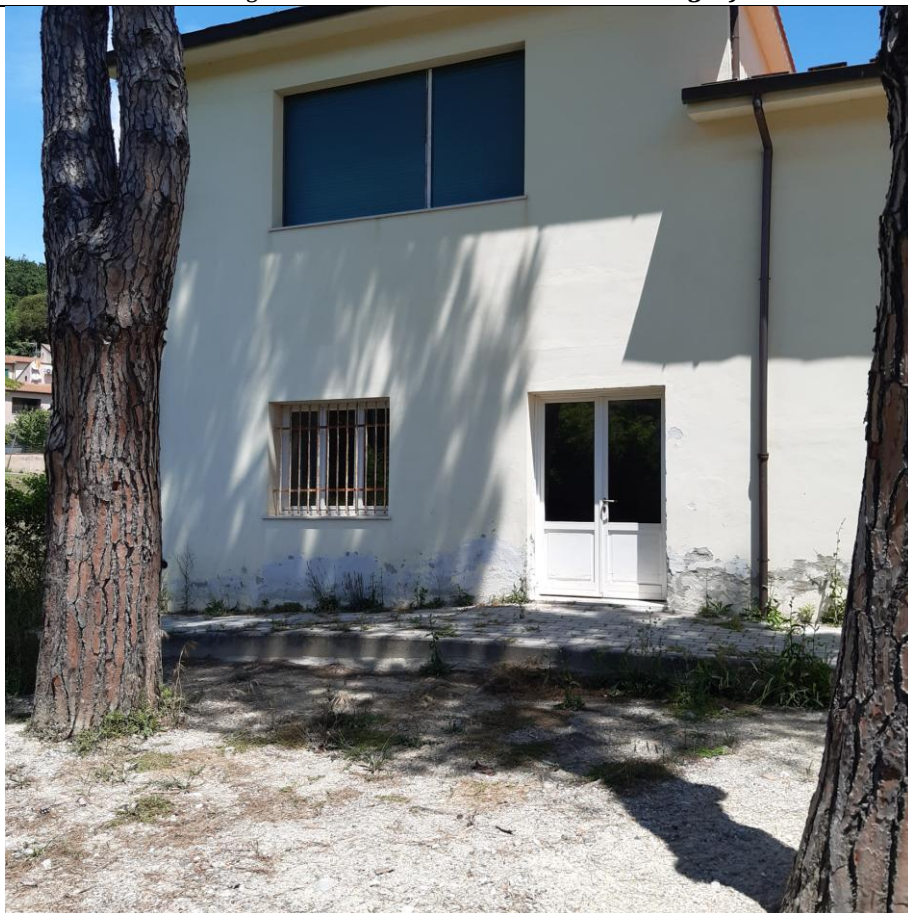
Foto 19: Prospetto Sud, ingresso locale attività motoria (foto giugno 2020)