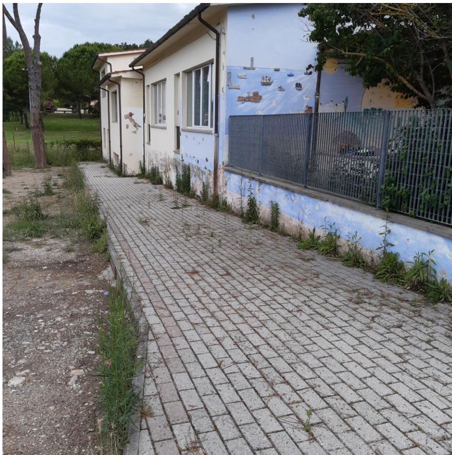
Foto 23: Prospetto Ovest particolare marciapiede (foto giugno 2020)