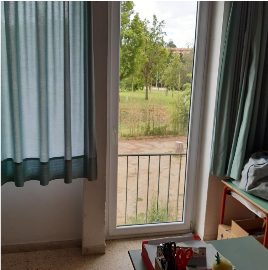
Foto 35: particolare infissi tipo in pvc di recente installazione (foto giugno 2020)