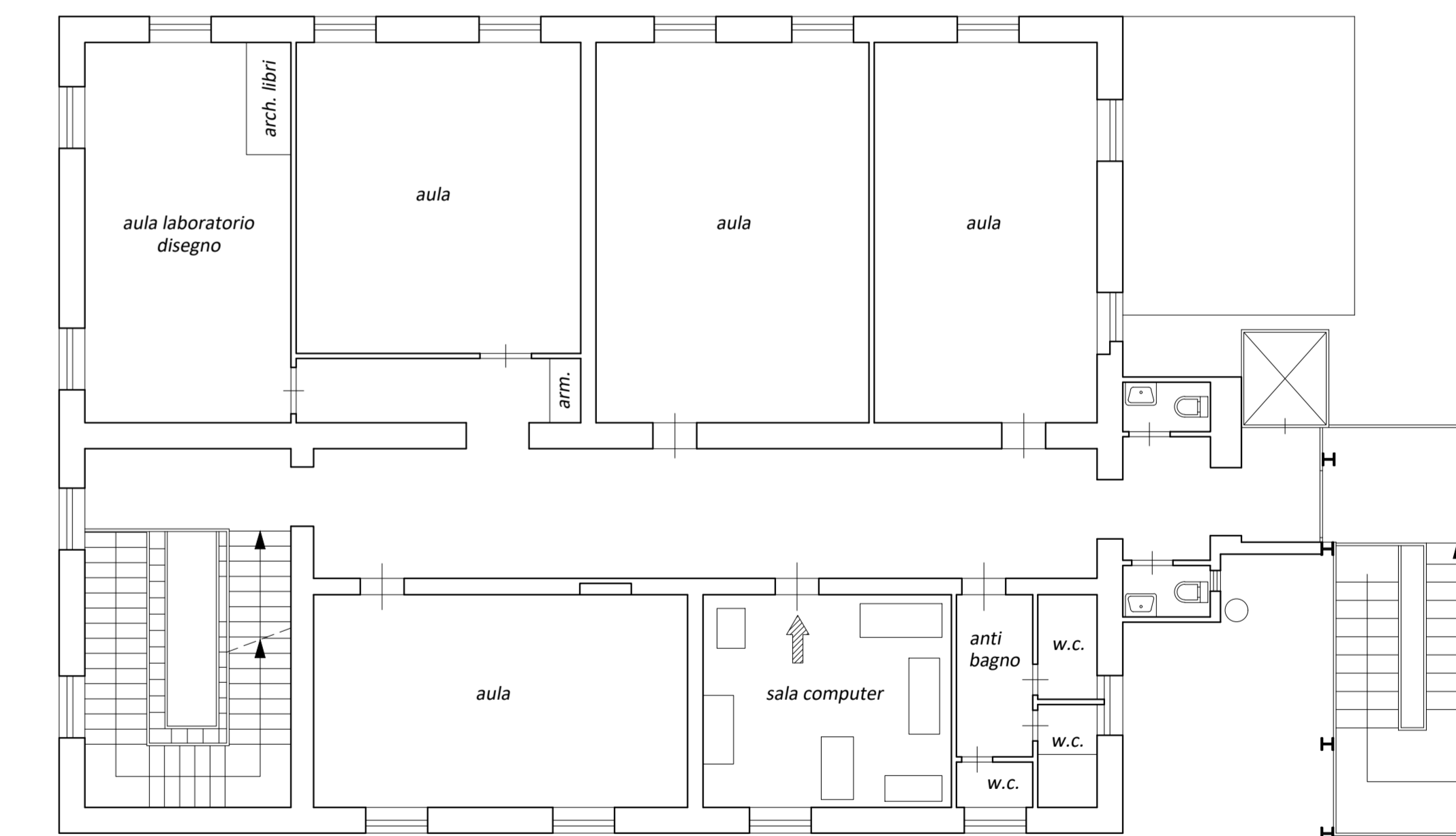
PIANTA PIANO SECONDO - STATO ATTUALE